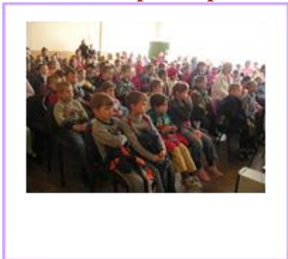
Юные зрители в гостях театра «Акцент»

Традиционно 1 июня, в День защиты детей, в музыкальном театре «Акцент» премьера нового спектакля для детей города.